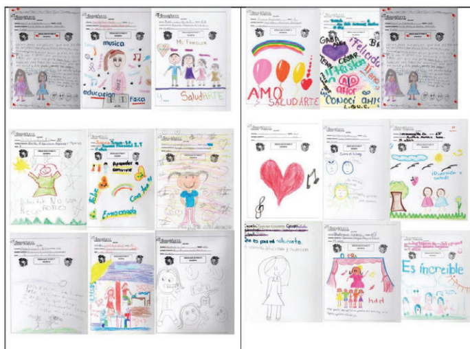
Dibujos realizados por niños y niñas de SaludArte.

La Educación Complementaria que origina SaludArte permite la convergencia de los intereses, expectativas y culturas de la familia, la escuela y la comunidad. Y con ella se promueve la interacción, y la construcción del pensamiento y formación integral de los niños, a la vez que revaloriza y potencia los aprendizajes construidos -siempre en la consideración de la relación familia-escuela-comunidad-La educación complementaria que caracteriza a SaludArte es un apoyo e insumo que se une a la educación formal de las escuelas de la Ciudad de México, ambas se dirigen a un objetivo central: impactar de manera directa o indirecta sobre la calidad de la educación y, en consecuencia, sobre el desempeño de las y los estudiantes.