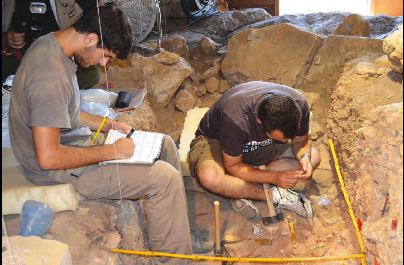
🔗 Dibujo y fotografía arqueológica apoyando el proceso de excavación.