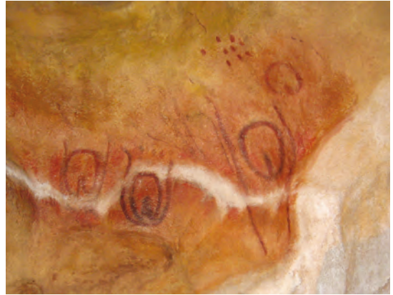
Fig. 2. Camarín de las Vulvas. Cueva de Tito Bustillo. Asturias. España.

Sumándose a la causa del dibujo, nos encontramos con la fotografía, que la complementa, a mi modo de ver perfectamente, y nunca deberían de ir desligadas en los trabajos. Si bien en el dibujo juega un papel fundamental el arqueólogo-artista mediante el buen empleo de su subjetividad, pues ya con sus trazos nos está interpretando el objeto/estrato, con la fotografía, dada su mayor objetividad, se nos abre un campo de interpretación diferente pero que viene a apoyar los datos del otro.