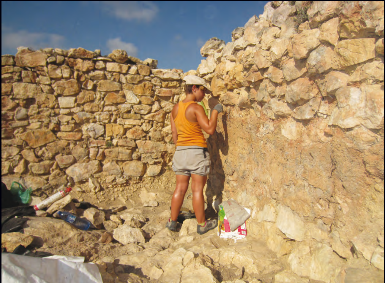
🔗 Labores de restauración en los muros de una fortificación de la Edad de Bronce en España.