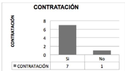
Figura 4. Tabulación de resultados – Indicador contratación de graduados.

En cuanto a la contratación de graduados en los últimos cinco años los encuestados responden que han sido contratados sin dificultad, generando una mayor tasa de empleabilidad, además, mencionan que, si reciben a estudiantes para las prácticas pre-profesionales, es decir existe aceptabilidad por parte de los empleadores.