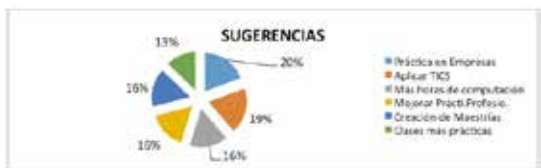
Figura 2. Tabulación de resultados – Indicador formación de futuros profesionales.

Sin embargo, a fin de analizar y revisar el perfil de egreso se preguntó que se califique las competencias necesarias para incrementar o eliminar en el perfil profesional y de egreso. Para el efecto se definió cuatro valoraciones en la escala de Likert: alto, medio, bajo y no aplica (Salinas, 2010).