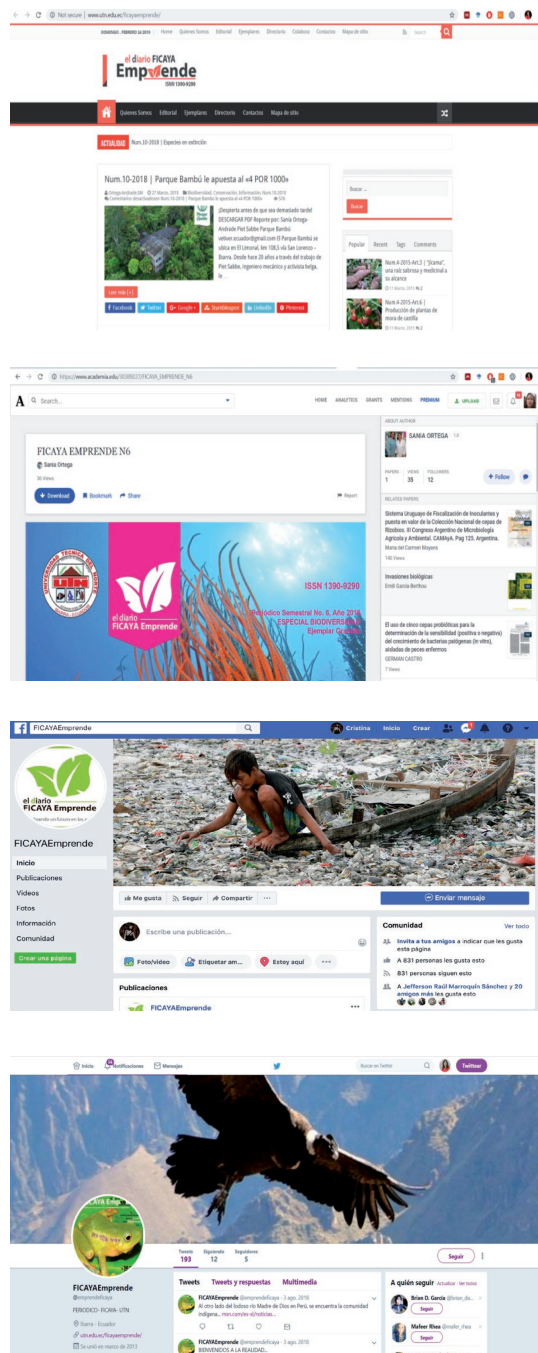
Figura 3. Presencia de Periódico FICAYA Emprende en redes sociales académicas y generales.

que está pasando en el mundo investigativo de la facultad FICAYA. Es interesante la visibilidad online que tiene esta publicación, porque incluso está presente en las redes sociales al tener perfil en Twitter en Facebook y también está en Researchgate y en Academia.edu. Se puede afirmar que es una publicación que usa bastante las redes sociales para diseminar información, lo único que no está constituida como revista científica.