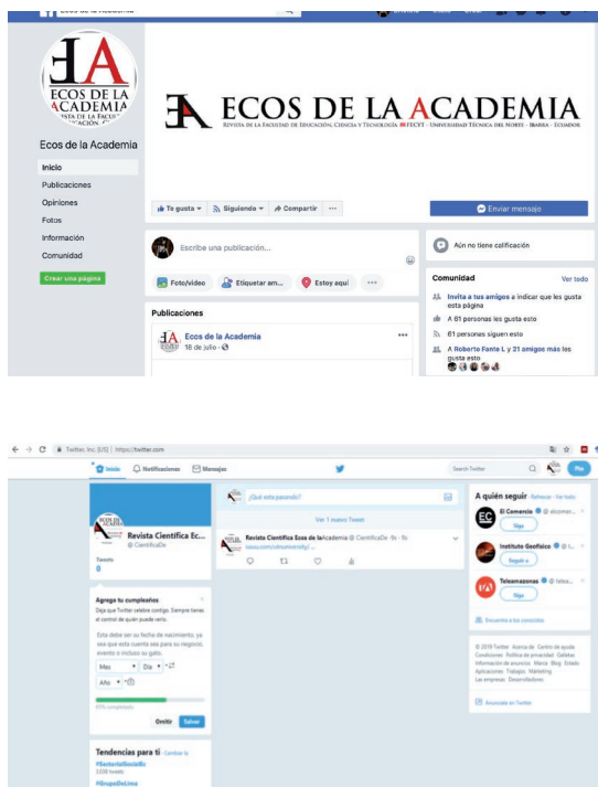
Figura 1. Presencia de Revista Ecos de la Academia en redes sociales académicas y generales.

En ese sentido los editores de esta revista están dando pasos significativos para su adhesión a SciELO, base de datos cuyo objetivo principal es aumentar la visibilidad de la ciencia producida en Latinoamérica, España y Portugal (Canales, Medín, Villegas, y Peña, 2009). Ecos de la Academia, es una revista con proyección online, que busca aumentar su visibilidad en redes sociales.