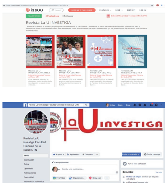
Figura 2. Presencia de Revista La U Investiga en la red y en Facebook.

La Revista La U Investiga está presente en Facebook. Al tener visibilidad online en la plataforma de la universidad y en redes sociales, se evidencia la estrategia de divulgación científica con un positivo uso de las TIC.