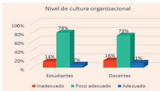
Figura 1: Nivel Cultura Organizacional UTN