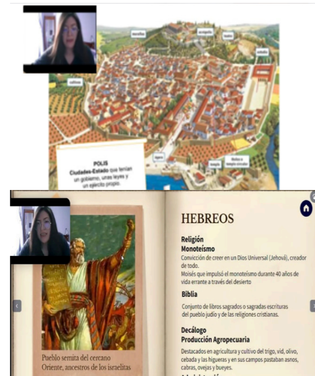
Figura 2 Combinación de texto con imágenes

diantes respondían con facilidad e incluso la clase fue más participativa. “Las imágenes, las fotografías y las obras de arte ofrecen como recurso educativo didáctico posibilidades para comprender, analizar, explorar, curiosidad de conocimientos, reflexionar conceptos y discutir en torno a ellos” (Rigo, 2014, p.1). El hacer uso de la estrategia propuesta despierta la participación de la clase, comparten sus opiniones, lo más interesante es que los docentes van a potenciar la capacidad de reflexión en sus estudiantes porque a partir de lo que conocen y lo que interpretan van a desarrollar argumentos propios.