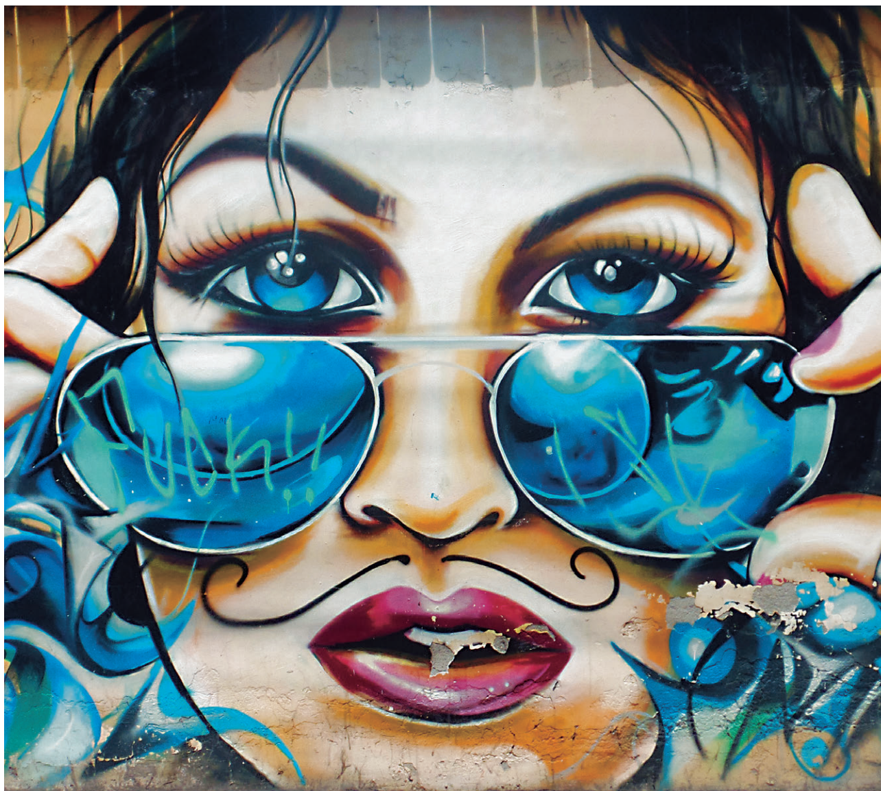
Fig. 1. Ejemplo de grafiti imbabureño, en un muro de Otavalo, creado por dos artistas de Peguche.

ciudad en general tendrán un documento de consulta que les permita potenciar sus capacidades cognitivas y desarrollar su sensibilidad estética como seres integrales y respetuosos de las distintas formas de expresión gráfica de la sociedad.