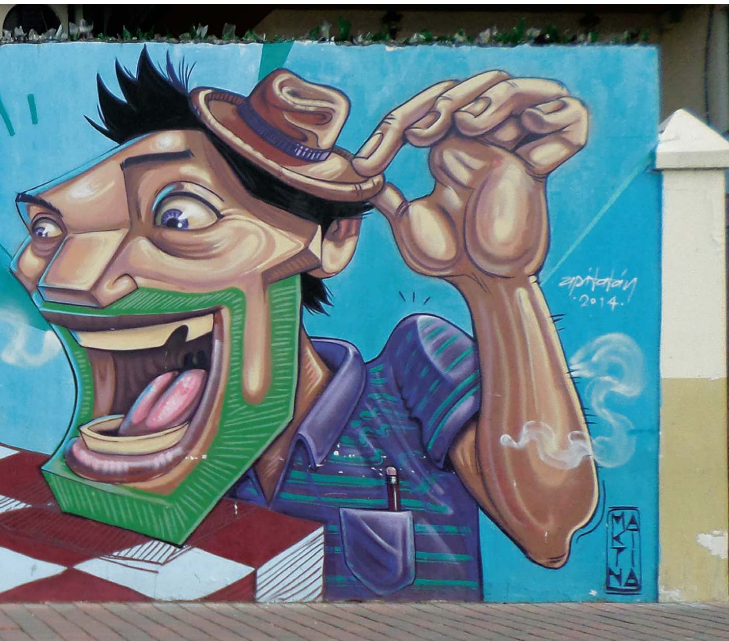
Fig. 2. Ejemplo de grafiti imbabureño, firmado por Apitatan en 2014, en un muro de la calle Pérez Muñoz, en Atuntaqui.

El arte del grafiti no conoce ni fronteras ni edades históricas, y es un fenómeno ampliamente estudiado. El prestigioso antropólogo catalán Manuel Delgado, afirma que se trata de un “insumisión signica” y señala en él las siguientes características, que compartimos totalmente: la audiencia diferida, el modelo tatuaje como vocación de indelebilidad e inadaptación a la vida y la voluntad narcisista de convertir la ciudad en un espejo reflector de un determinado universo simbólico. Es, de algún modo, la reivindicación del individuo frente la so-