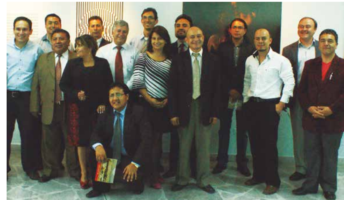
Participantes en la Exposición de Arte Contemporáneo de docentes de la FECYT.