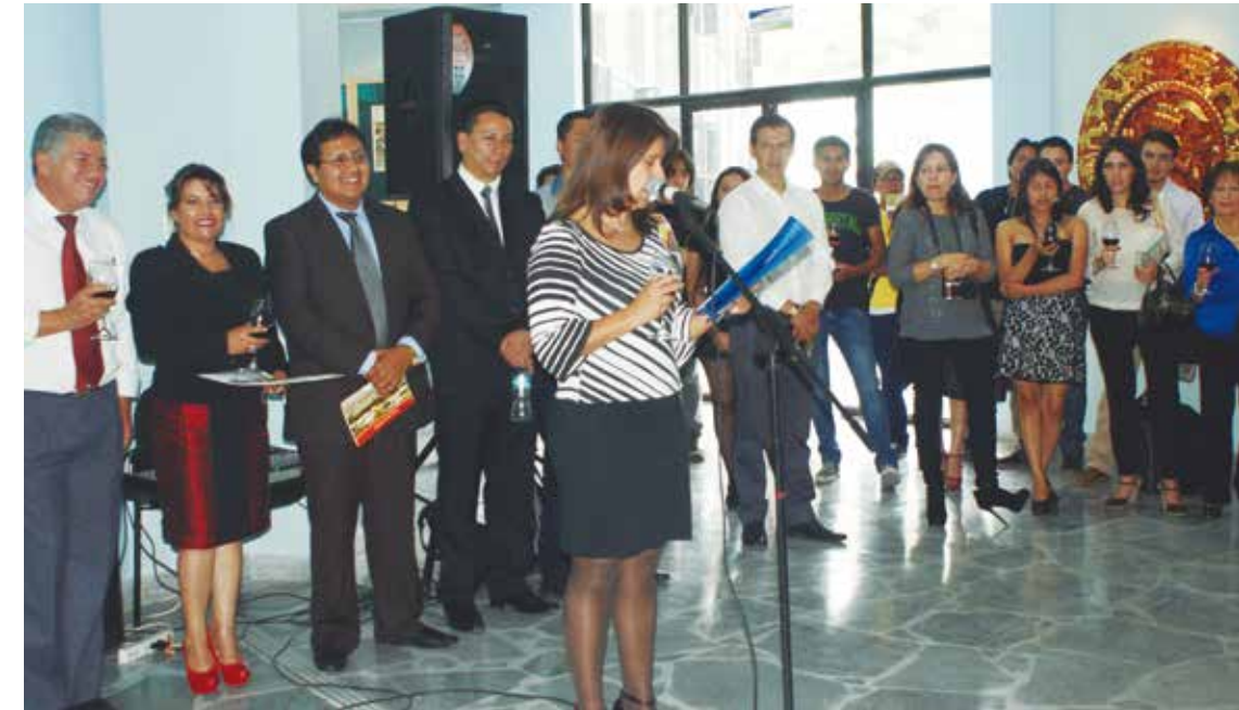
Inauguración de la Exposición de Arte Contemporáneo de docentes de la FECYT.