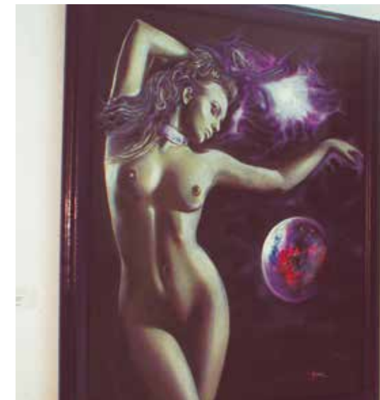
Pintura de Lucía López.