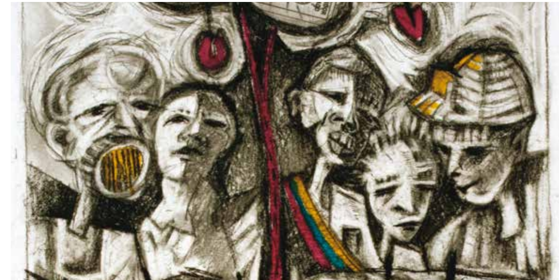
Fragmento de una de las obras expuestas, realizada por el artista y docente Marcelo Cervantes.