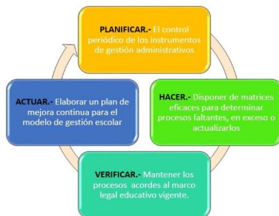
Gráfico Nº 4: Ciclo de mejora continua del modelo de gestión escolar

Como se manifestó al iniciar esta investigación, ningún modelo perdura por lo que es necesario realizar actualizaciones temporalizadas al modelo de gestión escolar propuesto, por estar inmersos dentro de esta sociedad cambiante los procesos también se vuelven dinámicos, desde este punto de vista la Comisión de Calidad tendrá que estar evaluando periódicamente la operativización de los instrumentos de gestión administrativa del equipo directivo, así como también los procesos implementados para el mejoramiento de la calidad educativa o Mejora Continua . Para este proceso nos apoyaremos con el ciclo de Deming ya que es recomendable para su actualización, como se muestra en la siguiente gráfica: